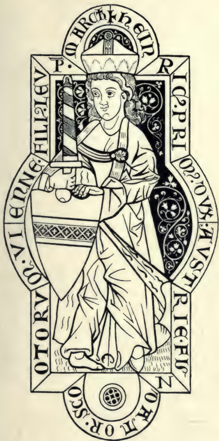
Herzog Heinrich Jasomirgott Glasgemälde im Kloster Heiligenkreuz